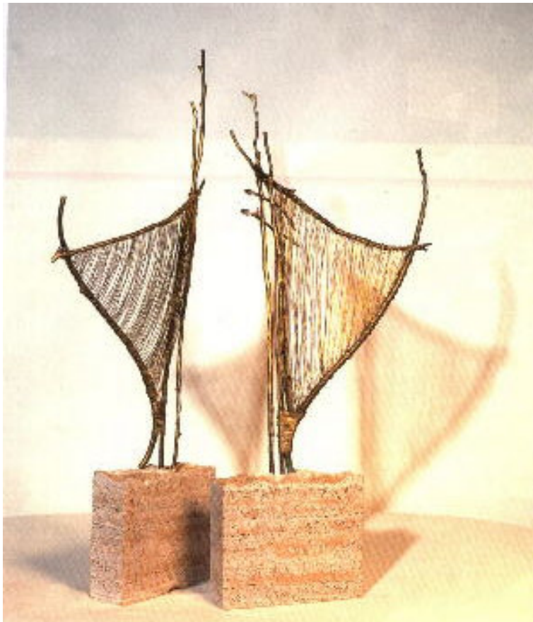
"El sonido" Mármol, bronce macizo y plata